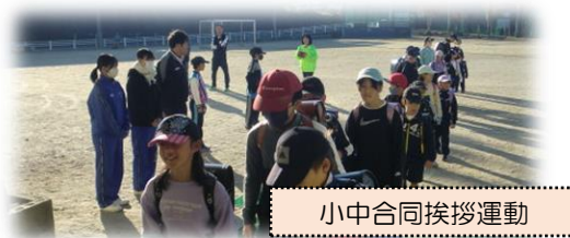
小中合同挨拶運動