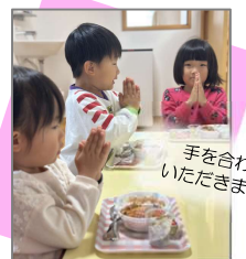
手を合わせていただきます！