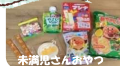
未満児さんおやつ