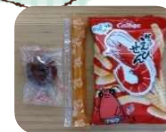
年少組以上のお友達