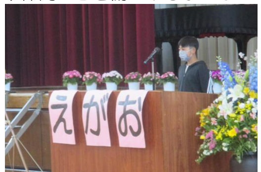
入学式：児童代表の言葉

令和5年度、東小学校の教職員は【 温かい人間関係の中で、一人一人が力を伸ばす学校 】をつくりあげるために「笑顔」をキーワードに、子どもたち一人一人の良い自分、新しい自分づくりの手助けをします。「笑顔」を生み出す挑戦に拍手を送ります。自分をだらしなくしていく子や仲間の心を傷つける子には内省を促します。保護者の皆様の相談にのったり、子どもたちの成長について一緒に考えたりします。何かご相談等がありましたら、遠慮なくお話しください。また、私たちも、子どもたちの成長など、保護者の方へ連絡をしていきたいと考えております。今年度も、よろしくお願いいたします。