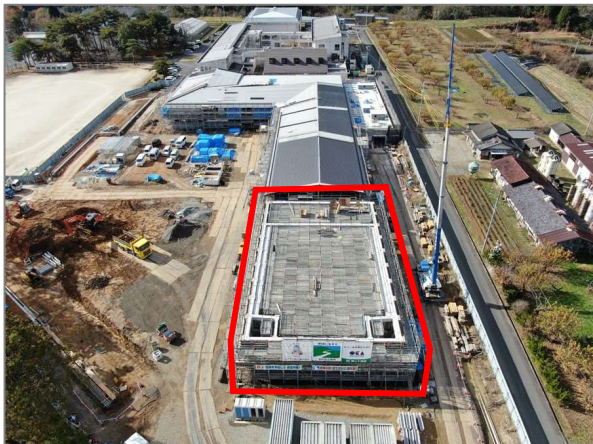
令和4年12月2日時点の様子