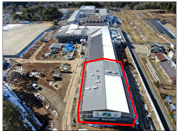
令和4年12月27日時点の様子