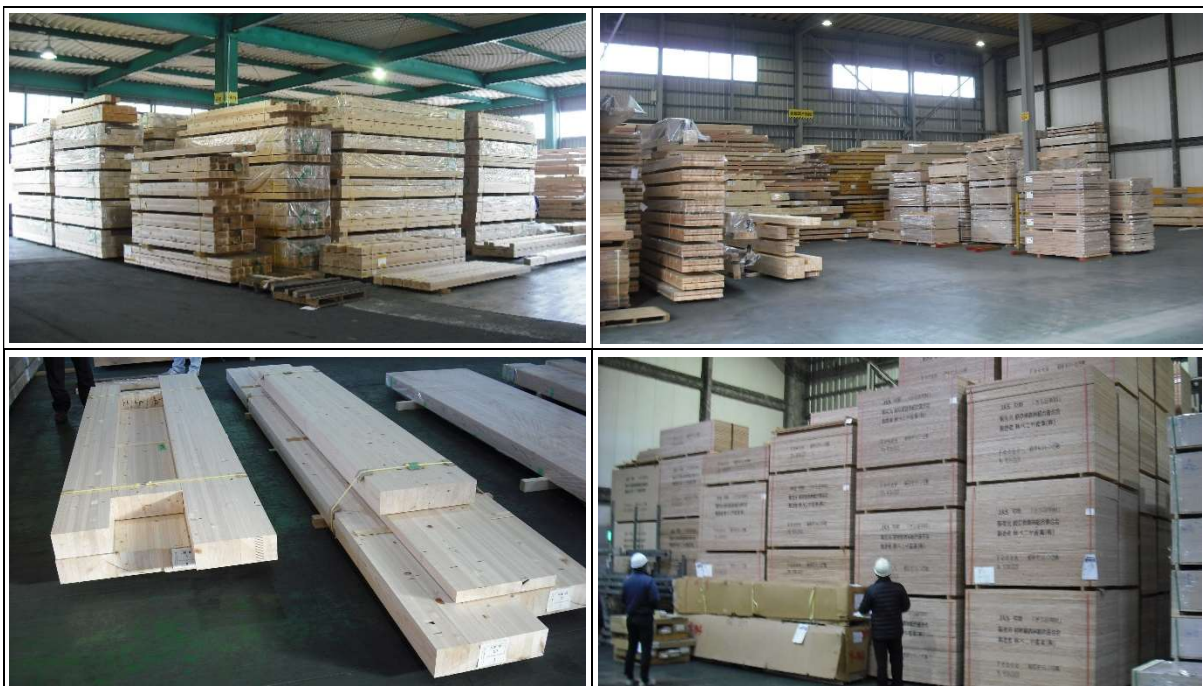
【加工を待ち倉庫で保管中の木材】