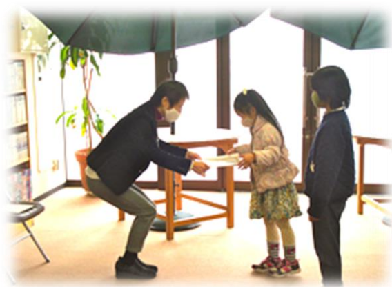
第10回はがきコンクール プチ表彰式