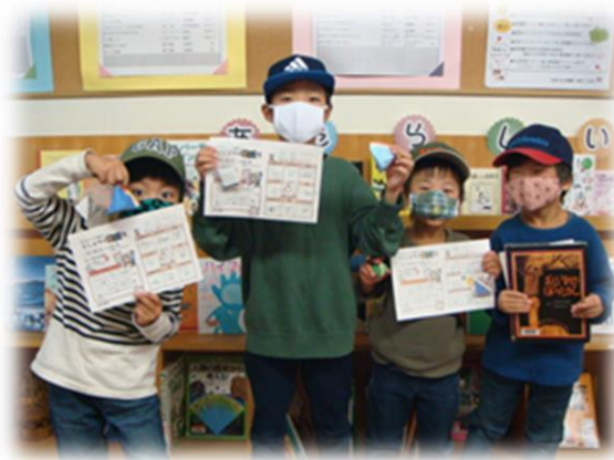
としょかんビンゴ