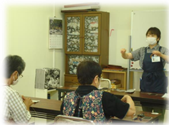
レジンで作る 大人のブローチを作ろう！