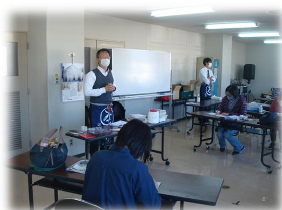
第9回図書館まつり『My手帳をつくろう！』