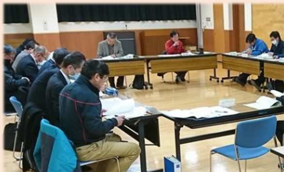
環境整備・PTA部会の様子

部会での検討課題の確認と、新しい学校への通学方法、通学路、スクールバスの運行等を議題として話し合いました。継続して協議していきます。