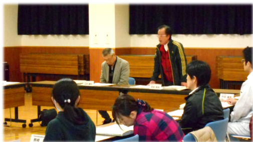
令和5年度統合時の児童数見込

現行の中学校のスクールバスの運行ルートに基づき、各地区、町内会の児童数や、通学距離なども参考にしながら、新小学校のスクールバスについて検討を進めています。