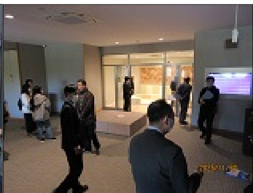
・待合ホール・キッズルームを視察している様子