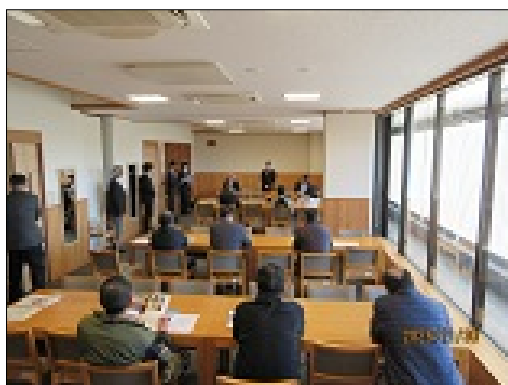
・施設完成までの取り組み説明や質疑応答を受けている様子