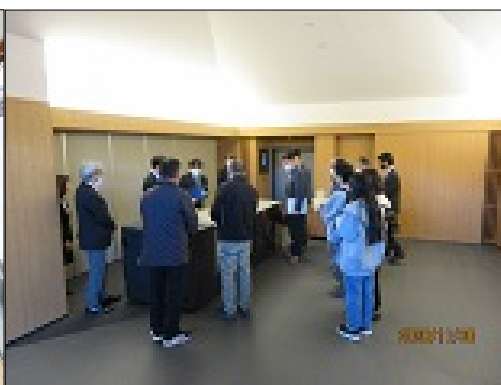
・多目的室・火葬炉を視察している様子