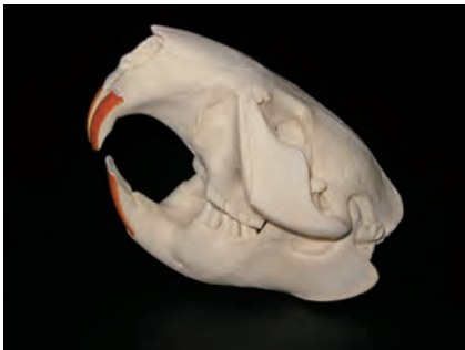
アメリカビーバー Castor canadensis 生息地 北アメリカ 頭骨前後長13cm 高さ5cm