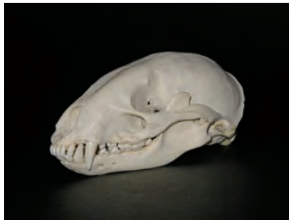
ニホンアナグマ Meles meles anakuma 生息地 愛媛県 頭骨前後長11cm 高さ5cm