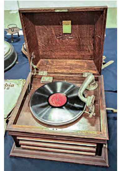
手回し式蓄音機(昭和初期)

展示室奥のウィンドウスペースでは、特別企画「前田青邨」を開催中です。中津川出身の画家・前田青邨の直筆手紙や絵画などを、期間ごとに入れ替えて展示していますので、あわせてご覧ください。