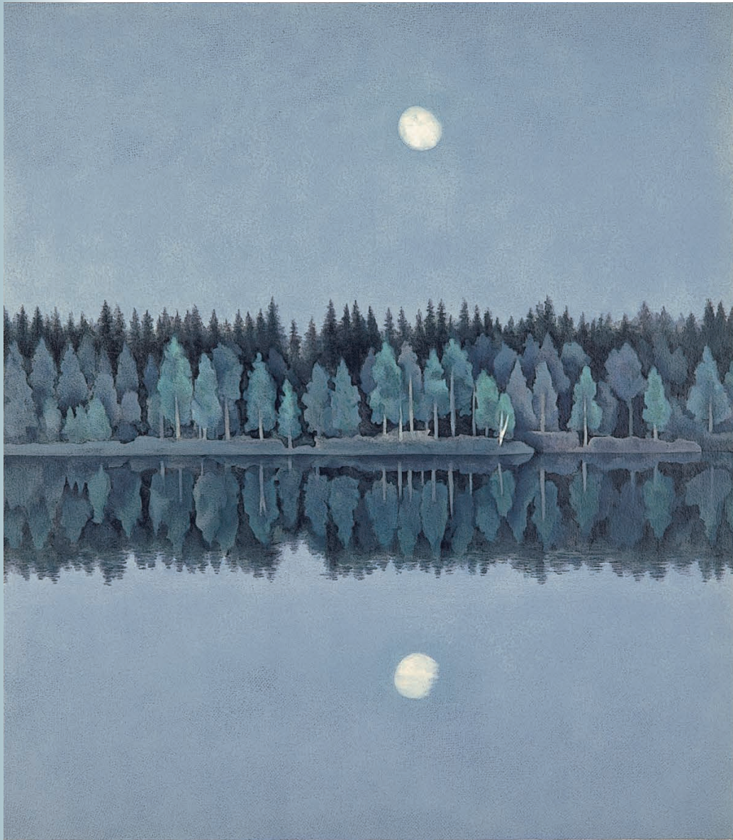
二つの月（リトグラフ）