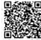
中津川市の博物館WEBサイトQRコード

最新情報は各館にお問い合わせください。 中津川市の博物館WEBサイトでもお知らせします。 ※右のQRコードを読みとると、中津川市の博物館WEBサイトが表示できます。