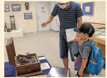
中山道歴史資料館