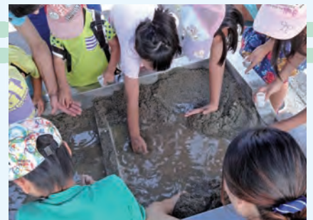
ジュエストーンさがし