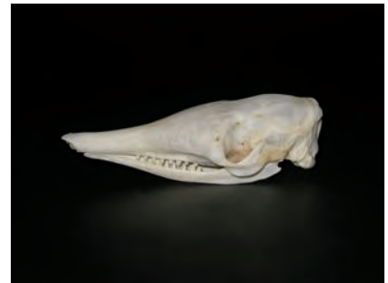
ココノオビアルマジロ Dasyus novemcinctus 生息地 ウルグアイ 頭骨前後長10cm 高さ3cm