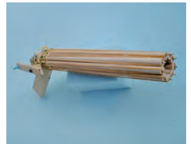
電動回転輪ゴム銃をつくろう