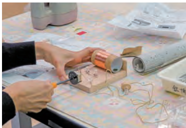
石で電波をつかまえるー鉱石ラジオづくり