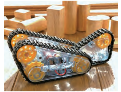
トリプルクローラーをつくろう