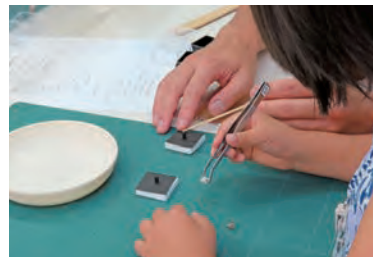
ちっちゃな鉱物を標本にしよう