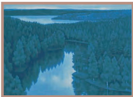
山湖遥か (リトグラフ)