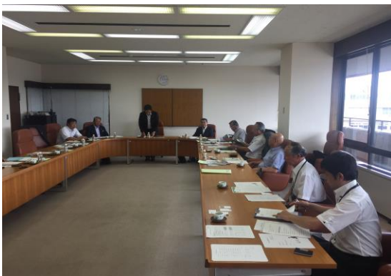
(菊川市役所内で説明を受ける)

さらには子育て世代が必要とするイベント情報等を随時更新・掲載するなどアプリの魅力と利便性を高める取り組みに努める。