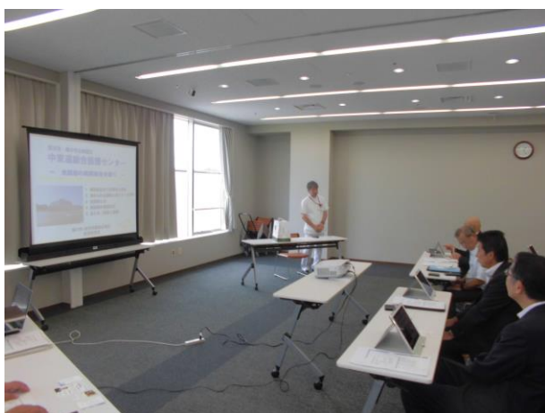
(院長から説明を受ける)