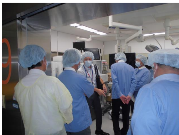
(先端医療機器の視察)