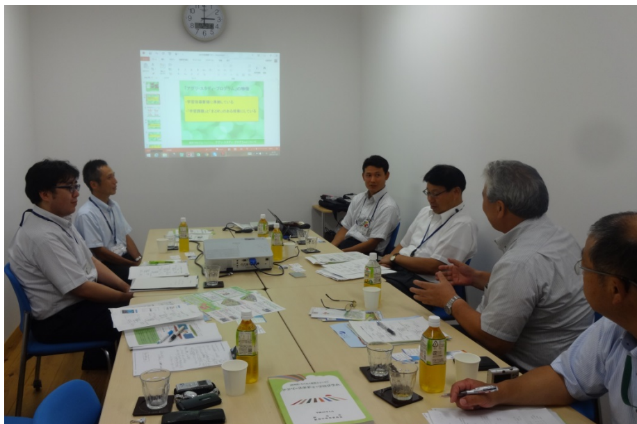
上の写真 新潟市 食育・花育センターでの視察研修会場

(北陸新幹線)－JR 長野 (中央線)－JR 中津川 16:39 17:00 19:08