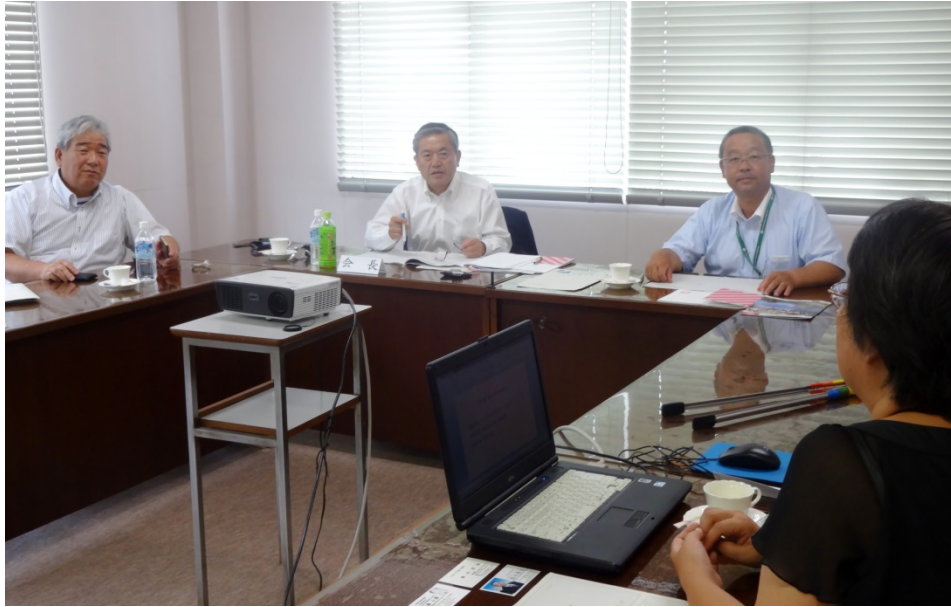
上の写真 三条市役所内の視察研修会場