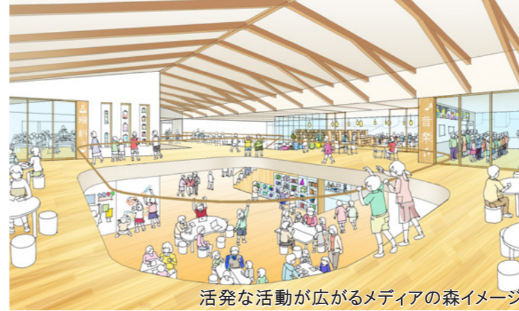
活発な活動が広がるメディアの森イメージ