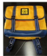
福岡小の通学カバン