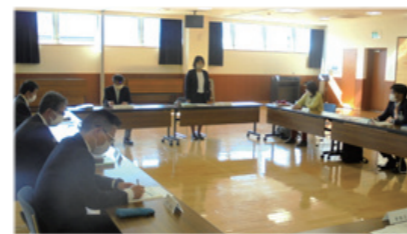
学校運営部会の様子

学校統合についてのお知らせは、統合準備委員会だよりにて、地域及び保護者の皆様に継続してお知らせします。