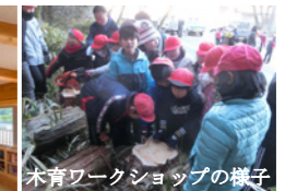
木育ワークショップの様子