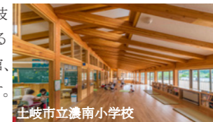
土岐市立濃南小学校

㈱石本建築事務所さんは、昨年準備委員会が学校視察の際に訪問した土岐市立濃南小学校の設計者です。暖かな木造校舎の建築で木育や、木の香る学校環境が高く評価されました。本市では、市役所庁舎、中津川文化会館、中央公民館、市民病院と市の重要な施設を多く手掛けていただいています。大いに期待できる設計チームが担当となりました。