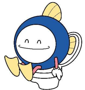
下水道協会マスコットキャラ スイスイ