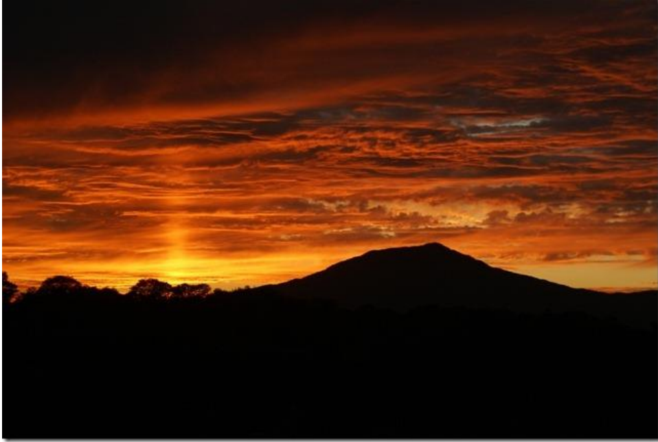
中津川市側から見た笠置山