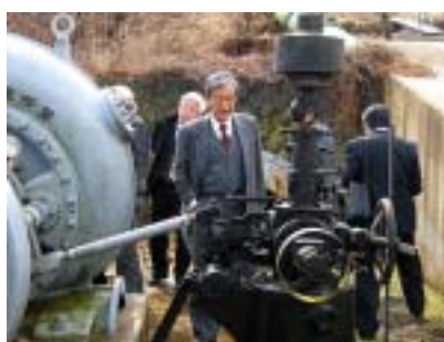
第 2 回の先進地見学会