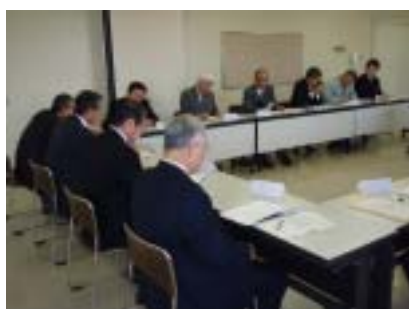
第 1 回の討議

これから、市民・事業所が主体になって小水力発電を計画する場合には、必要に応じて市民委員会を開催しますので市役所にご相談ください。