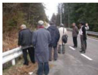
第 3 回の候補地視察(小郷)