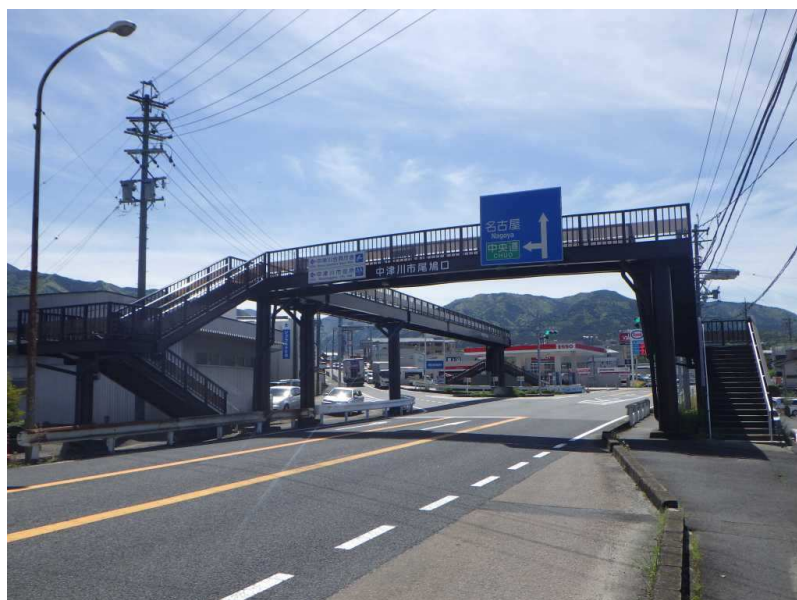
尾鳩口横断歩道橋