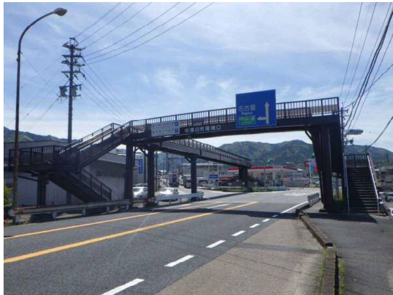
尾鳩口横断歩道橋