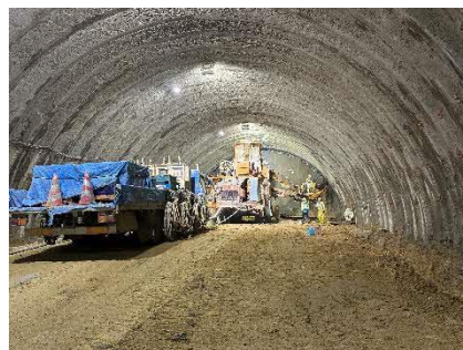
写真 トンネル坑内状況