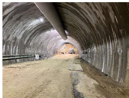
写真 トンネル坑内状況