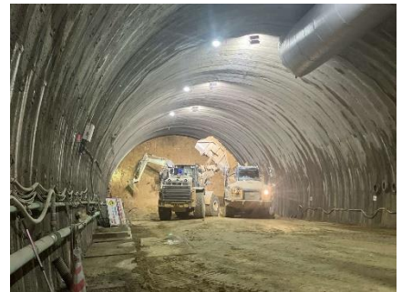
写真 トンネル坑内状況