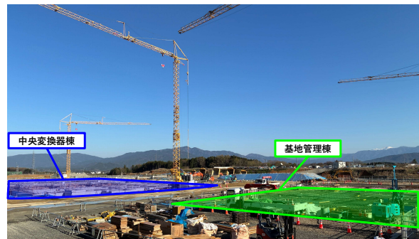
建物工事範囲 遠景写真