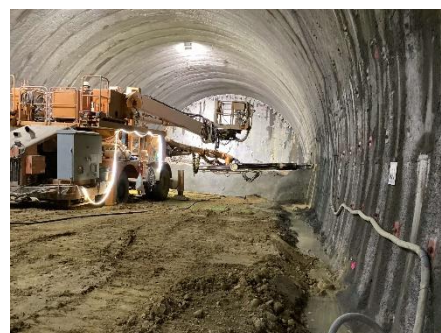
写真 トンネル掘削状況