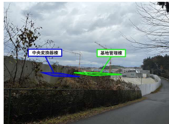
建物工事範囲 遠景写真