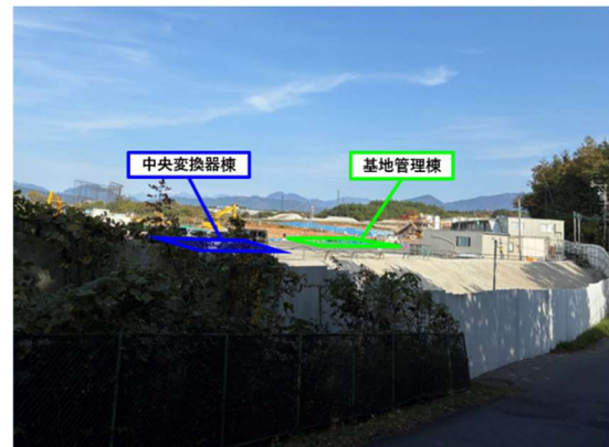
建物工事範囲 遠景写真