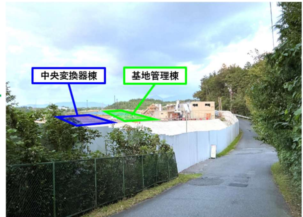
建物工事範囲 遠景写真