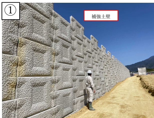
【状況写真 R7.4 月時点】