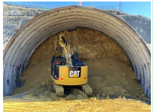
写真 トンネル掘削状況