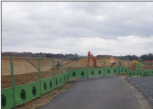
【施工状況・表土すきとり】