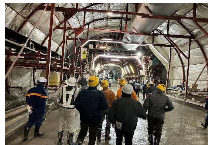
現場見学会開催しました