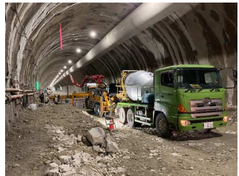
写真-1 インバートコンクリート施工状況

右の写真は、トンネルの下側のアーチ部分（インバートと言います）のコンクリートを打設している状況です。