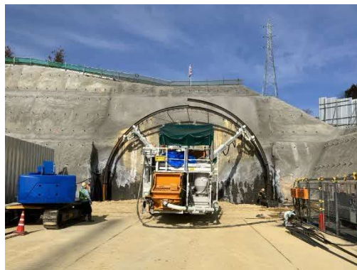
写真 トンネル坑口設置状況