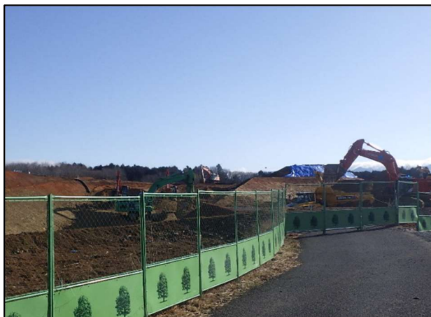
【施工状況・表土すきとり】