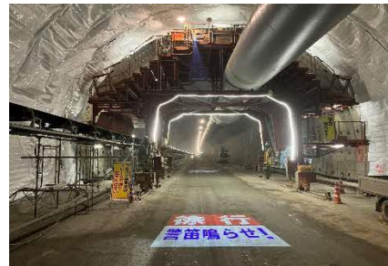
覆工コンクリート工事