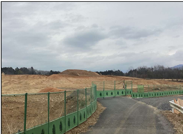
【施工状況・表土すきとり】