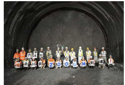
本坑品川方 2000m到達時