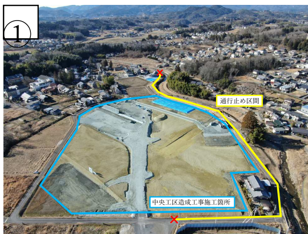
【状況写真 R6.1 月時点】