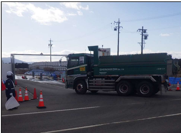
【進出入路仮設ゲート・発生土受入】