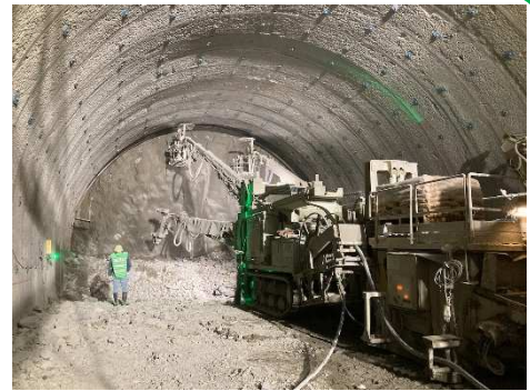
写真-1 鋼製支保工設置状況

右の写真は、鋼製支保工（トンネル形状に曲げ加工したH形鋼）の設置状況です。鋼製支保工は発破により掘削した空間を、コンクリートや鋼棒とともに、支えている重要な部材です。