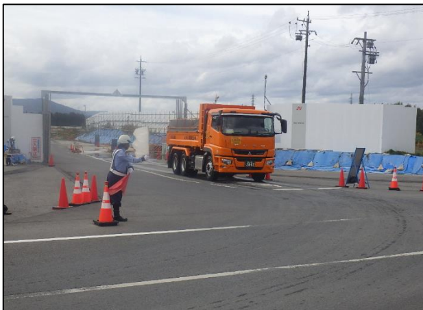
【進出入路仮設ゲート・発生土受入】