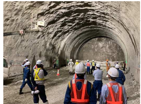
写真-1 安全パトロール状況

右の写真は、JR東海と合同で実施した安全パトロールの状況です。今後も、事業者と施工者が力を合わせて、安全に工事が進められるように、取り組んでいきます。