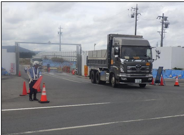
【進出入路仮設ゲート・発生土受入】