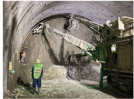
写真-1 鋼製支保工建込み状況

右の写真は、鋼製支保工の建込み状況です。工場で曲げ加工したH形鋼を、トンネル形状に合わせて設置し、吹付けコンクリートやロックボルトと共に、地山を支持します。