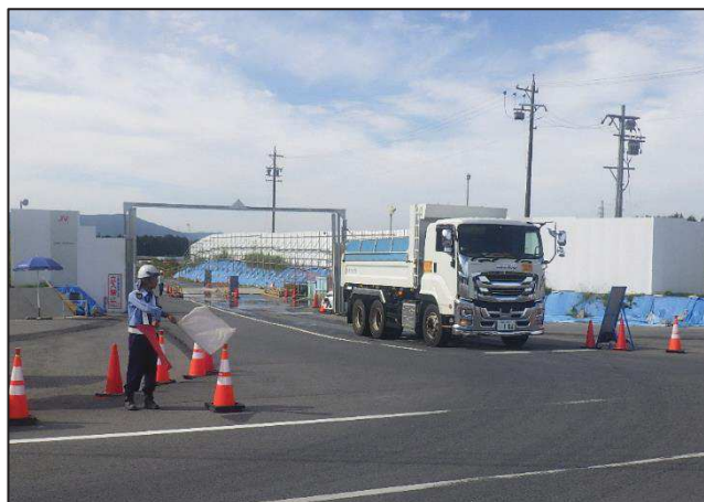
【進出入路仮設ゲート・発生土受入】