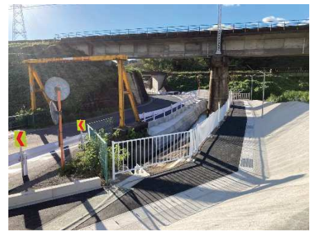
写真-1 落合完成状況

右の写真は、市道落合23号線で施工していた箇所完成後の状況です。道路は拡幅され、歩道は新しく綺麗になりました。