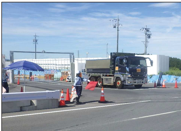
【進出入路仮設ゲート・発生土受入】