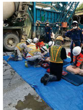
中津川消防署との救護訓練状況