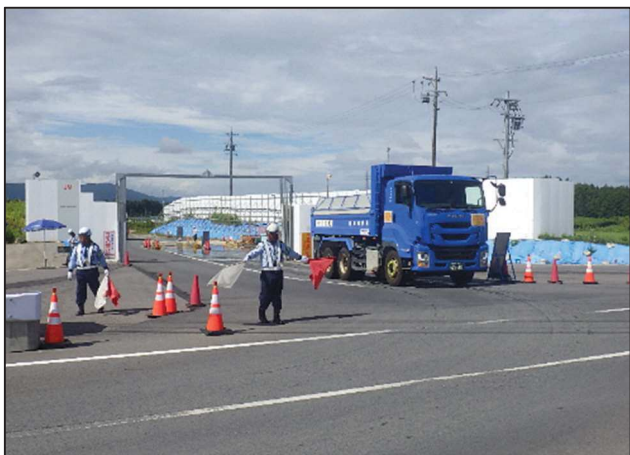
【進出入路仮設ゲート・発生土受入】