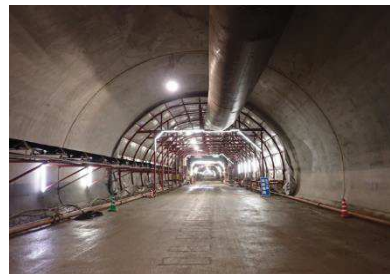
路盤・覆工コンクリート状況