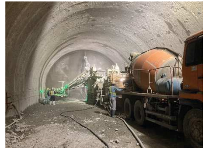
写真-1 吹付けコンクリート施工状況

右の写真は、吹付けコンクリートの施工状況です。発破で掘削した地山をコンクリートで早期に支え、地山を補強しています。